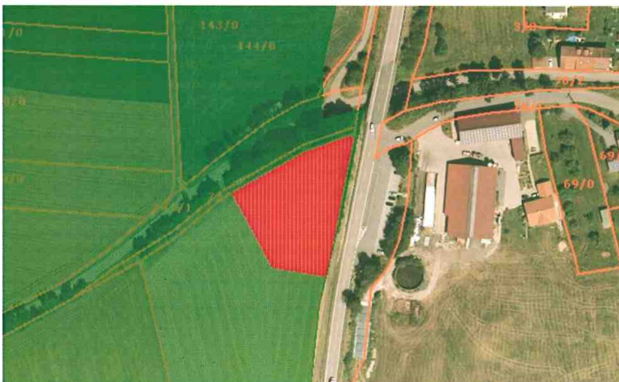
M 1 : 2.500 Grün: LSG (Landschaftsschutzgebiet – Bestand), Rot: Herausnahmefläche